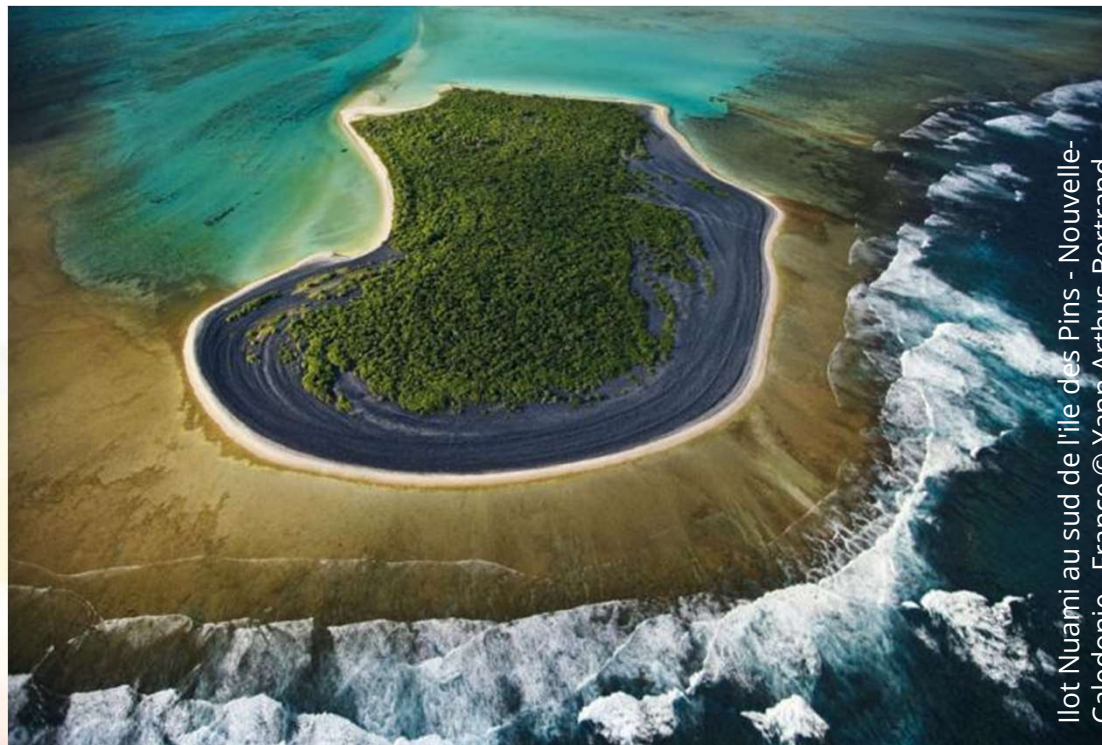
Ilot Nuami au sud de l'île des Pins - Nouvelle-Caledonie - France