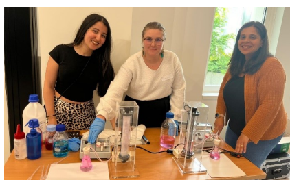
Présentation d'un kit de dépollution de l'eau par photocatalyse

Ce fut un franc succès, avec plus d'une quarantaine de personnes qui ont échangé sur ces thématiques cruciales pour le développement soutenable. Ces discussions seront prolongées de manière plus spécifique dans les mois qui viennent. Nous vous tiendrons informé.e.s !