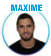
Kinésithérapie - Paris