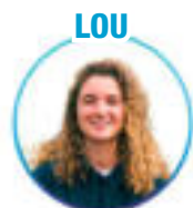
STAPS - Marseille

Pour un enseignement supérieur et une recherche inclusifs, écologiques et émancipateurs !