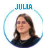
Métiers de la culture - Rouen