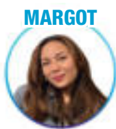
Chirurgie dentaire - Amiens