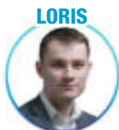
Administration publique - Lille