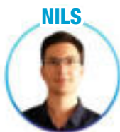
Ingénieur doctorant Centrale - Nantes