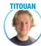
Géographie - Tours