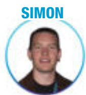
BUT Sciences et génie des matériaux - Pau