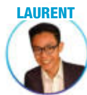
Médecine - Sorbonne Paris-Nord