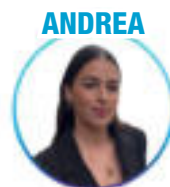
Management et commerce international - Créteil