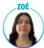
Psychologie - Paris Cité