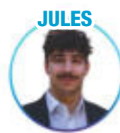
STAPS - Angoulême