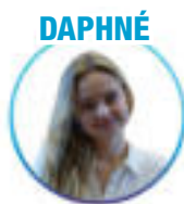
Droit des affaires - Nantes