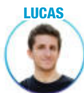
Médecine - Lyon 1