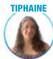
Sociologie - St-Étienne