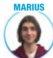
Lettres modernes - Avignon