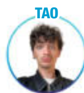
Droit et sciences politiques - Lyon 2