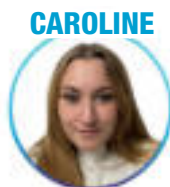
Sciences de la vie - Strasbourg