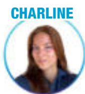
STAPS - Reims