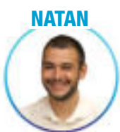
Pharmacie - Nancy