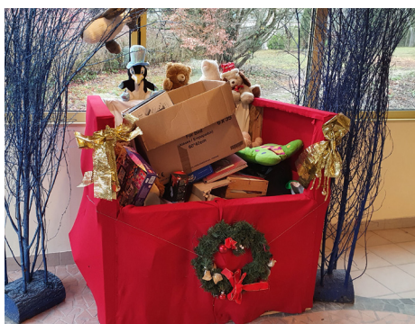
Collecte au CROUS