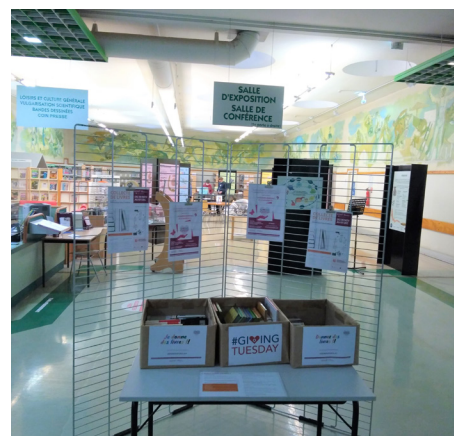
Collecte à la Dibiso