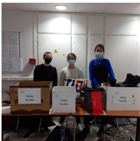
Collecte à la Faculté de Médecine