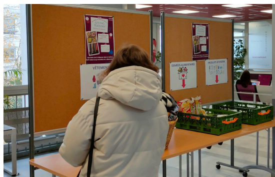
Collecte à l'IUT de Sceaux