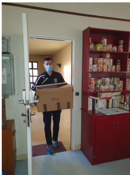
Collecte au profit de l'AGORAé