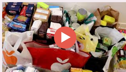
Résultat de la collecte d'Orsay

Bravo à l'équipe opérationnelle du pôle de compétitivité Systematic pour ses collectes de denrées alimentaires, de vêtements et de jouets.