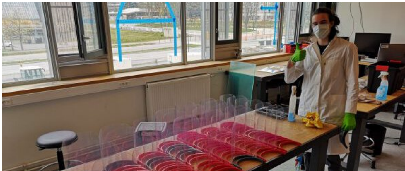
Fabrication à plat, par découpe 2D, de visières complètes au FabLab Digiscope de l'Université Paris-Saclay